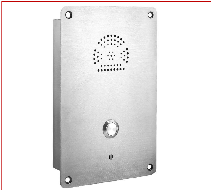
Teléfono resistente a la intemperie